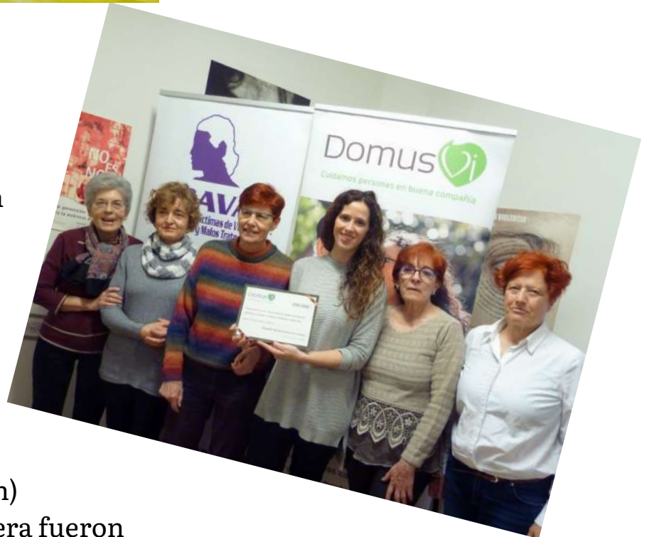
V Legua Popular Villamandos (León)