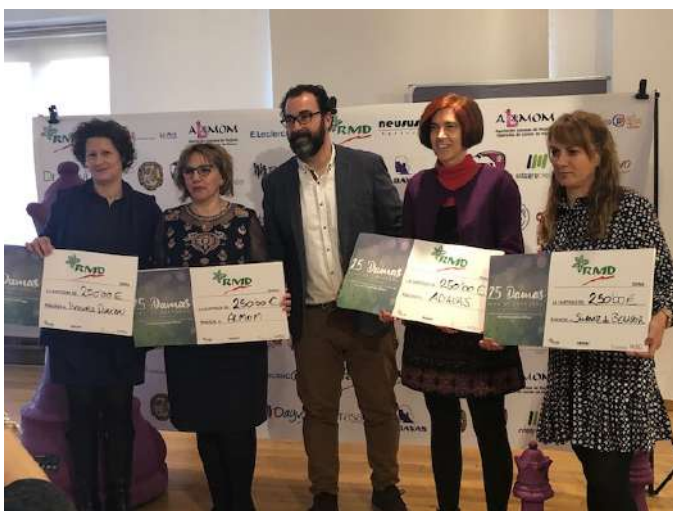
RMD Donación 25 Damas para 25 empresas