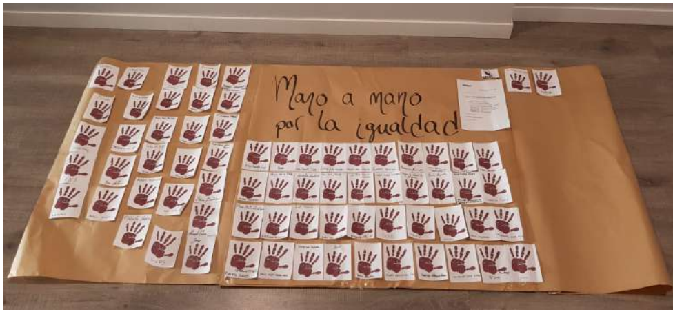
Lactiber SL – Donación de lo recaudado en la actividad del mural “Mano a mano por la igualdad”