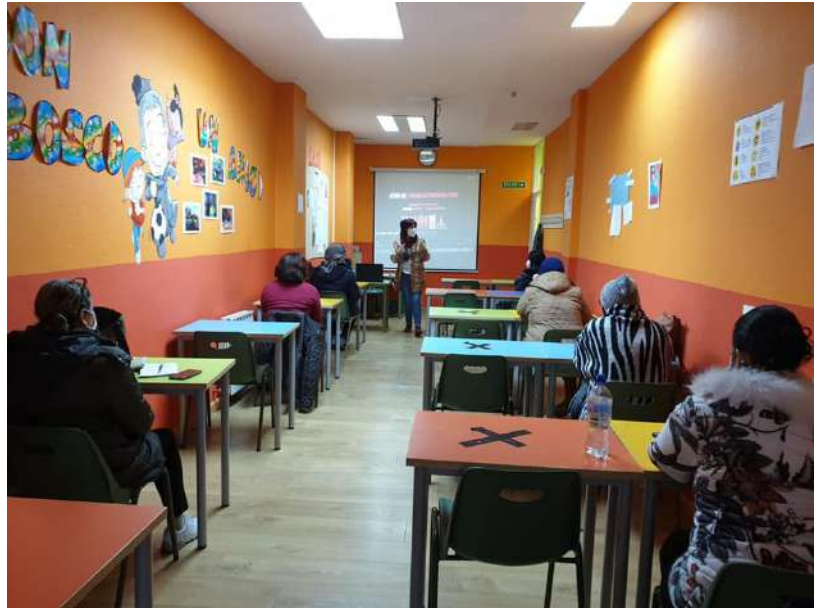
Taller de prevención de la Violencia de Género Asociación Valponasca León