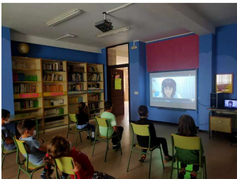
Kamishibai de la Igualdad Cra de Huergas de Babia