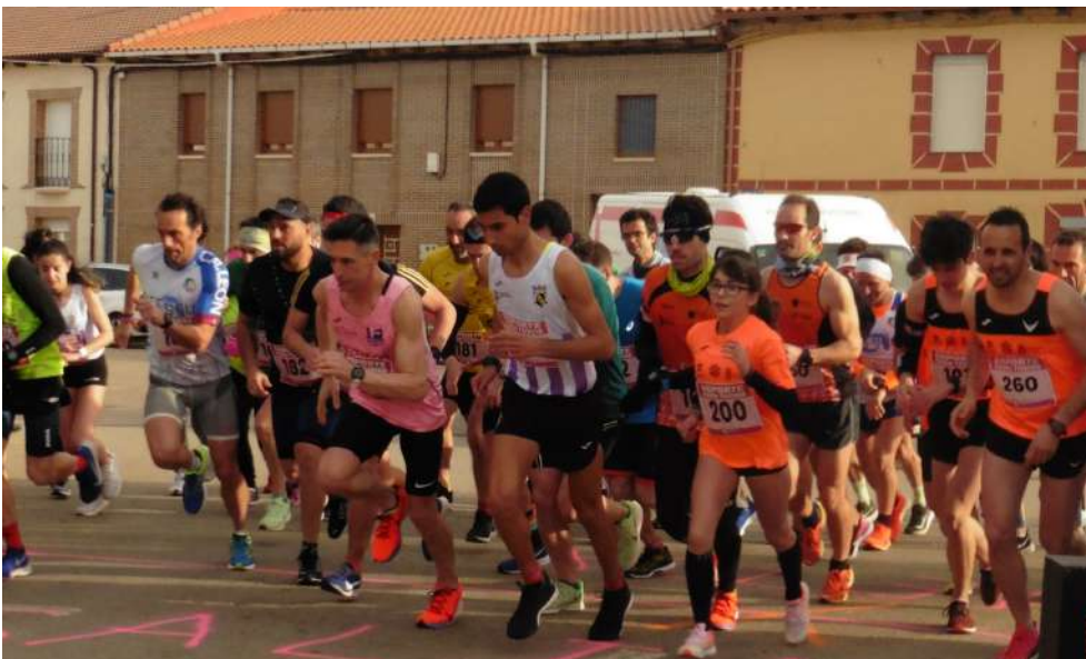
Los beneficios de esta carrera fueron donados a ADAVAS por el Ayuntamiento