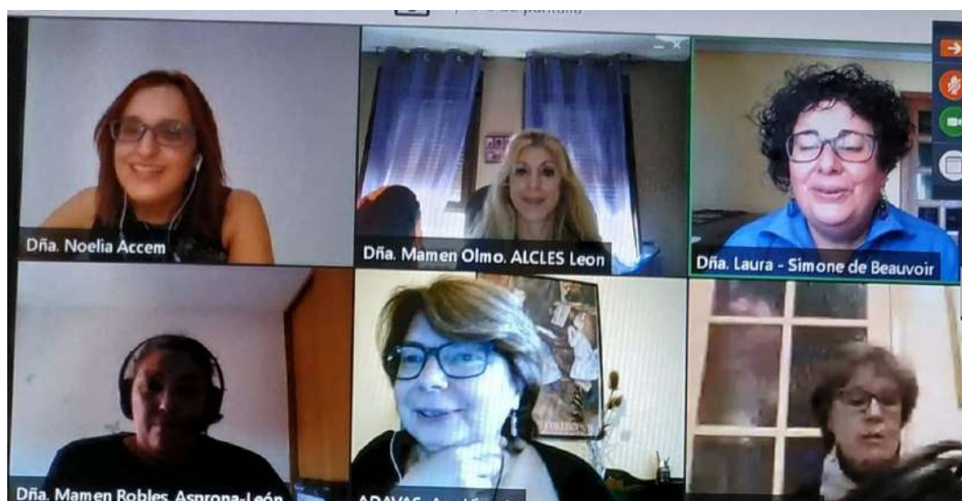
VII Feria de Voluntariado Participación de ADAVAS en la mesa "Mujeres y Voluntariado"