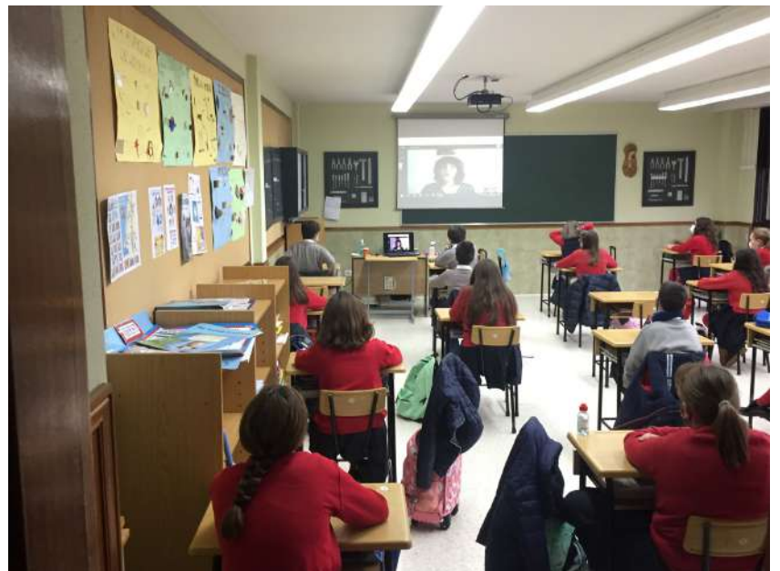
Taller sobre Igualdad Colegio Discípulas de Jesús León