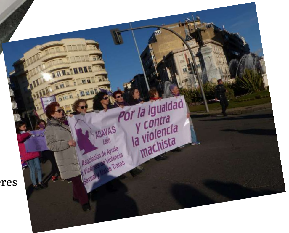
Manifestación 8 de marzo. Día Internacional de las Mujeres