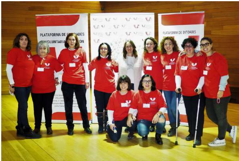
X Aniversario de la Plataforma de Entidades de Voluntariado