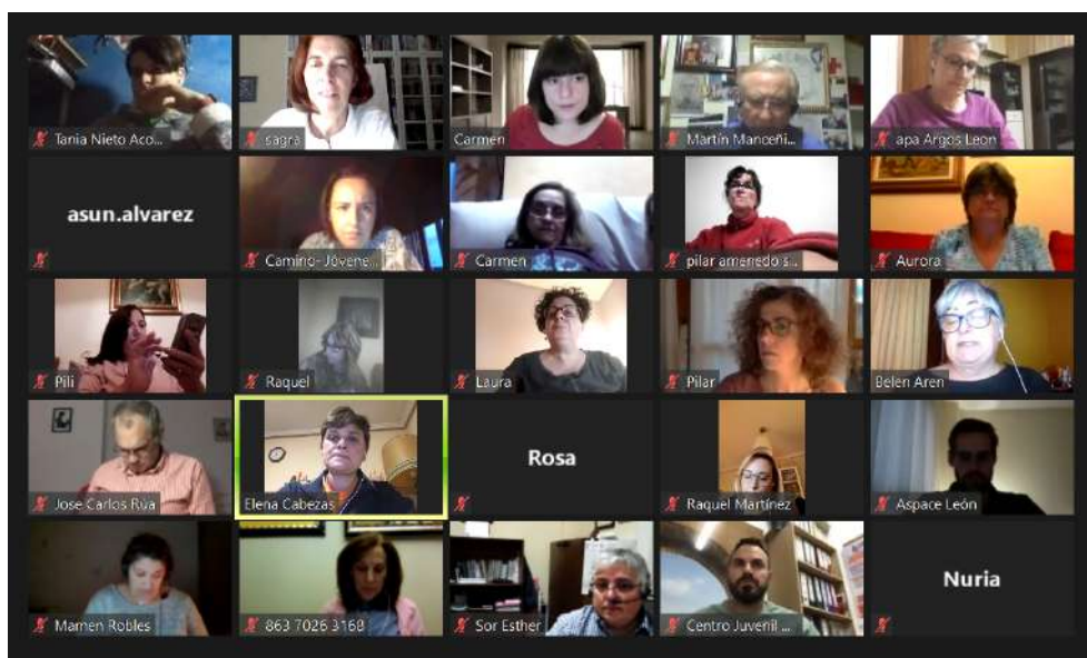
Reunión con la Plataforma de Entidades de Voluntaria de León