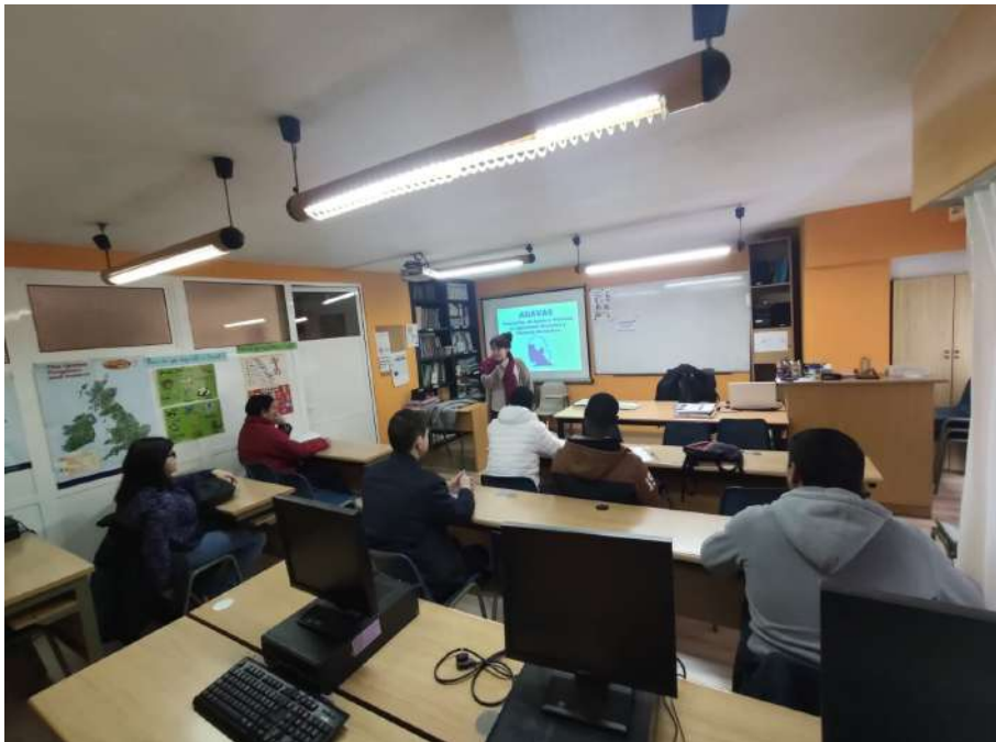
Taller sobre Igualdad ACCEM