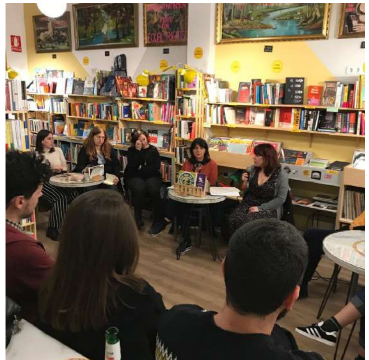
Charla en la librería café "La Mona Sputnik"