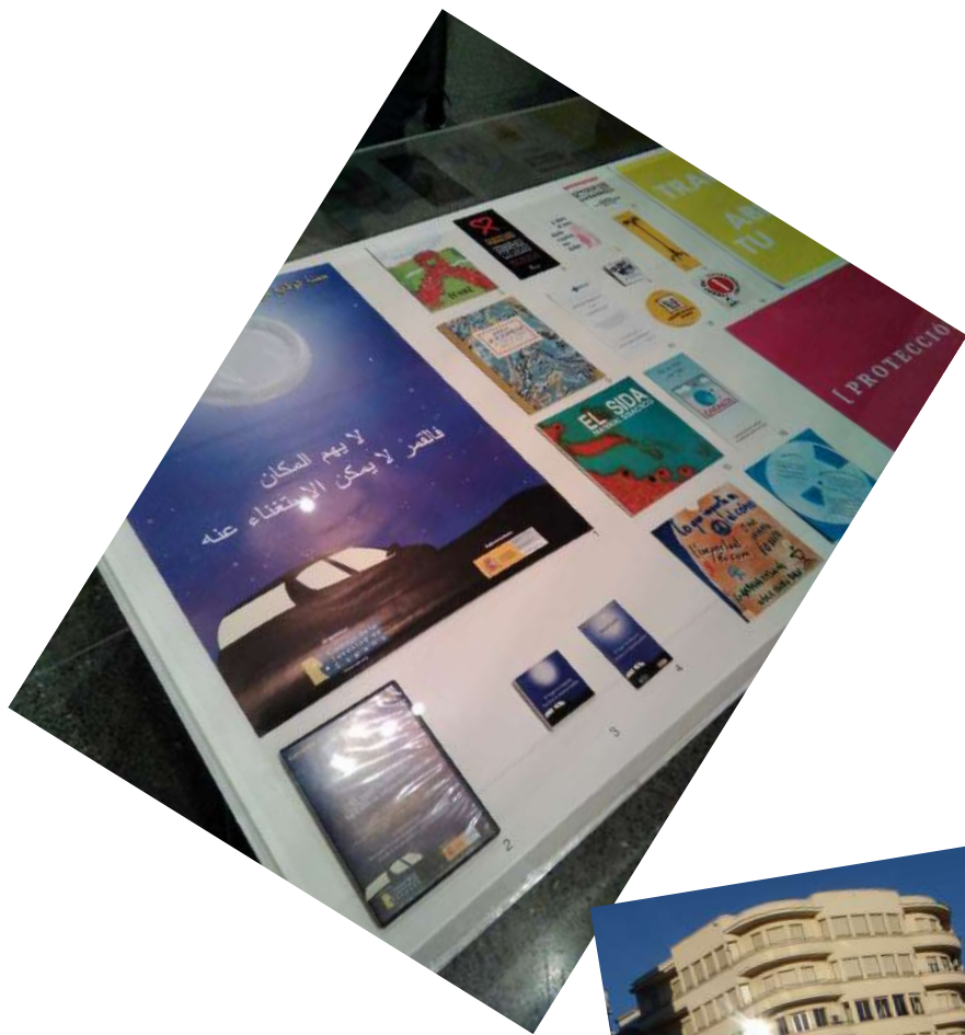
Exposición "Performar el Género. Corporalidades y Feminismos", en el Musac. Material donado por ADAVAS